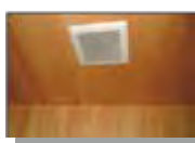
頻繁に 結露する部分