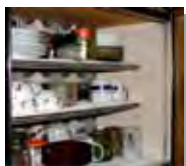
食器棚などの内部