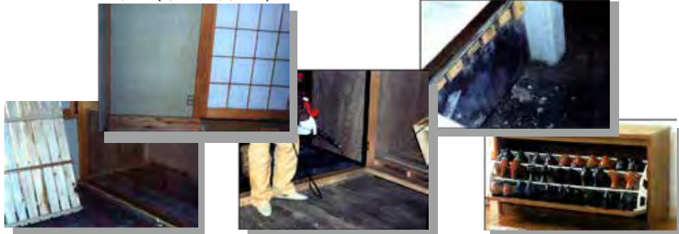
押入内(床・天井・壁)