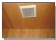
頻繁に結露する部分