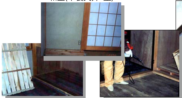
押入内(床・天井・壁)