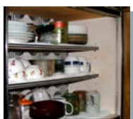
食器棚などの内部