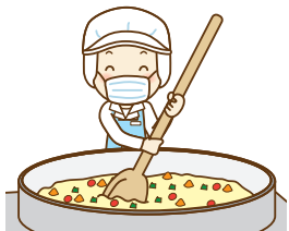
各種食品製造工場