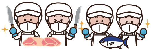
食肉・鮮魚等加工場