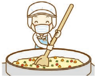
各種食品製造工場