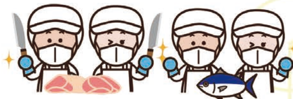
食肉・鮮魚等加工場