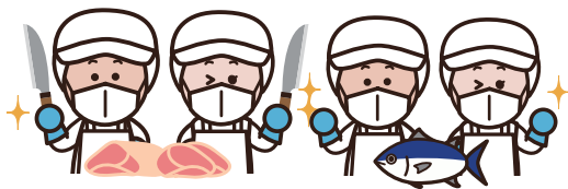
食肉・鮮魚等加工場